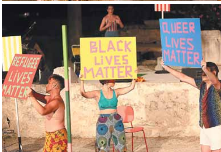
«Η Κιβωτός του Νώε»

«Σεμπάσιαν/Vanitas» έως 3/6, Βιομηχανικό Πάρκο ΠΛΥΦΑ (Κορυτσάς 39, Αθήνα)