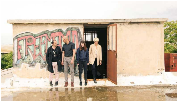
«Ο θρύλος του αγίου Κάρτακ και το μικρό λουλούδι»

Μετά το «Greek Freak», το ροκ αντάρτικο του Σίμου Κακάλα στο Ολύμπια, το Φεστιβάλ Αθηνών δίνει τη σκυτάλη του πειραματισμού σε δύο ακόμη άξιους εκπροσώπους του, προσφάτως βραβευθέντες στα Queer Theatre Awards και ικανούς να κάνουν την Πειραιώς 260... αγνώριστη.